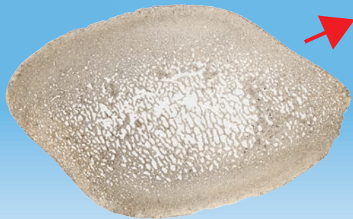
アキシマクジラと推定される肋骨化石の断面

ガラスの板に薄い化石を貼り付けて、さらに光を通すほど薄くした「薄片」は、骨の組織のような細かい構造をみるのに有効な手法です。本展では、所蔵の化石から作成した「薄片試料」をご紹介します。