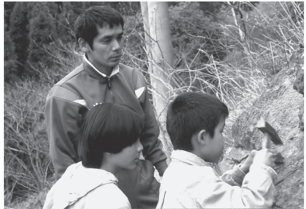
図3. 佩楯山層群の化石採集会（大分県豊後大野市・三重町佩楯山）。家族同伴で参加。子どもにはこのハンマーは重すぎるようだ（1996年4月29日）。

そのあと適当に配車分乗して出発する。参加者は原則として会員中心であるが、春の採集会同様非会員のまぎれ込みもある。配車は道路状況や駐車の関係で車種や大きさを選択する。非会員の方で家族同伴で積極的に参加される意欲には敬服するが、現場で困惑することもある。いずれにしろ、資料の準備の都合から事前に申し込んでくれれば、あえて参加をお断わりすることはない。指導者は、会員の中から対象地域をホームフィールドとする研究者（大学院生を含む）に依頼する。巡検に大変重要な地域であるにもかかわらず、会員に適切な指導者がいない場合には、会員を通じて県外の研究者（非会員）に依頼することがある。この場合、若干の謝金を準備する。巡検ルートの中に化石産地があれば、採集はもちろん行すが、主として化石包含層の堆積構造、それを挟む上下単層の岩相と境界部の詳細な観察、それらに基づく類推事項について体験的に考察する。会員の中には、これまでの興味中心の化石採集から地史学、古生物学における化石の位置付けが自覚され専門の道に進んだ人が幾人かいる。