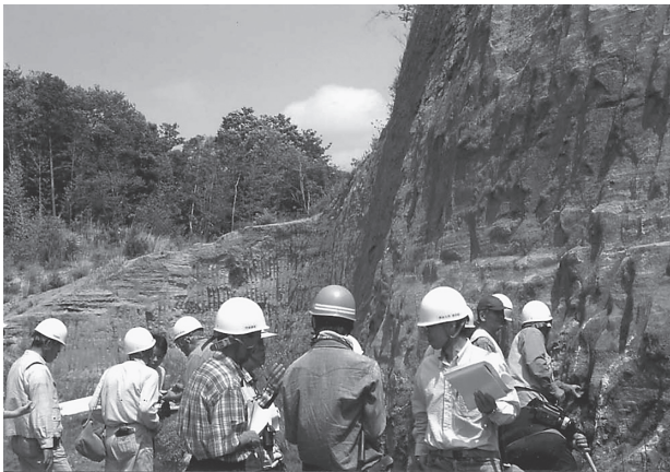
図2. 大分層群の巡検（大分市滝尾・宅地造成地）。作業現場への立ち入りはヘルメット着用が義務付けられている（2003年4月29日）。