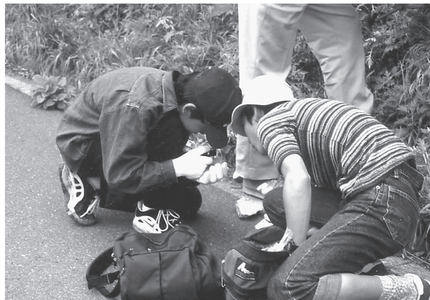
図6. 見つけた化石を観察する中学生（大分県津久見市・八戸地区，1999年10月11日）。